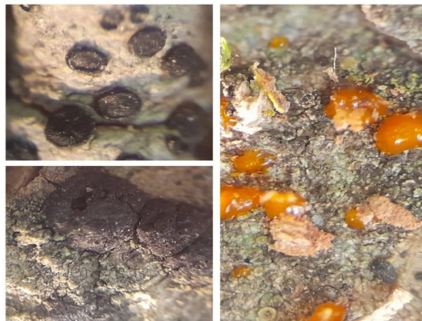
شکل ۴- استروماتای تیره رنگ عامل شانکر سیتوسپورایی روی پوست درخت لور