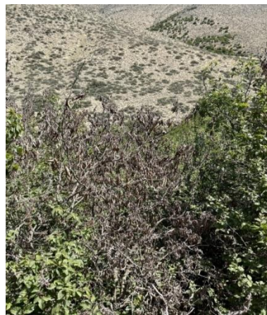
شکل ۱- شاخه‌های خشکیده لور