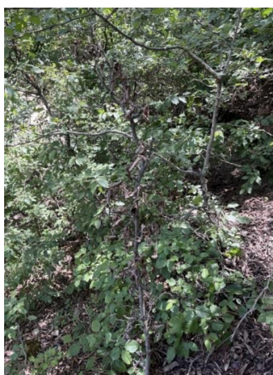
شکل ۳- گسترش آلودگی و خشک شدن قسمت فوقانی شاخه‌ها

می‌یابد، شاخ‌وبرگ تغییر رنگ می‌دهد، در بهار و تابستان هنگامی که شانکر به دور شاخه مانند کمربندی توسعه می‌میرد و برگ‌های خشکیده روی شاخه‌های مرده باقی می‌مانند (شکل ۳).