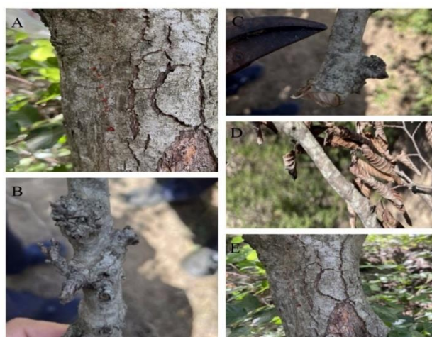
شکل ۲- A: شانکر و تراوشات بیماری روی تنه درخت لور. B-E: شانکر، تراوشات بیماری و پوسته سفید رنگ ناشی از آن روی تنه درختان لور