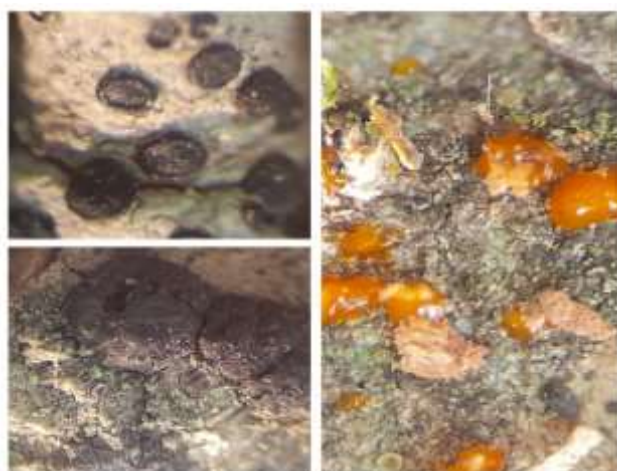
شکل ۴- استروماتای تیره رنگ عامل شانکر سیتوسپورایی روی پوست درخت لور