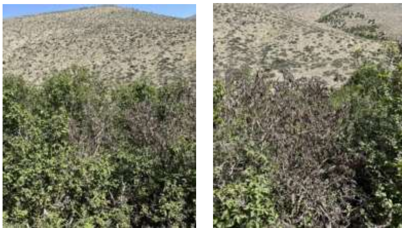
شکل ۱- شاخه‌های خشکیده لور

جنس مرمر ( Carpinus L. ) از خانواده غان ( Betulaceae ) و از جنس‌های مهم گیاهیست. این جنس دارای سی و پنج گونه درختی، خزان‌کننده و یک‌پایه است که مختص نیمکره شمالی هستند و از اروپای جنوبی تا جنگل‌های شمال ایران امتداد یافته‌اند ( Suszka et al. , 1998). این جنس در ایران در سرتاسر جنگل‌های خزری از گرگان تا ارسباران پراکنده است. گونه لور یا مرمر کوهی ( Carpinus orientalis Mill. ) گیاهی درختچه‌ای یا درختی کوچک با ارتفاع حدود پنج متر است که نسبت به مرمر در