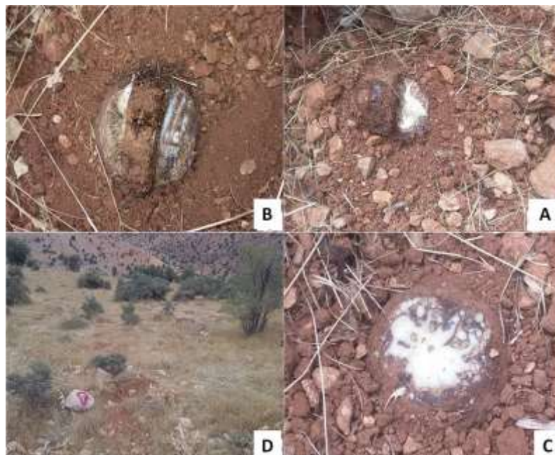
شکل ۲. تصاویری از انواع روش‌های برش: یک‌طرفه (A)، دو‌طرفه (B)، سنتی (C)، پوشاندن سطح ریشه پایه‌های گیاهی پس از برش (D) Figure 2. Different cutting techniques; Unilateral (A), Bilateral (B), Traditional (C), Covering surface plant roots after cutting (D)

پایان دوره بهره‌برداری گودال‌های حفرشده با خاک اطراف محدوده گودال برای حفاظت ریشه پایه‌های گیاهی پوشیده شدند (شکل، ۲ D).