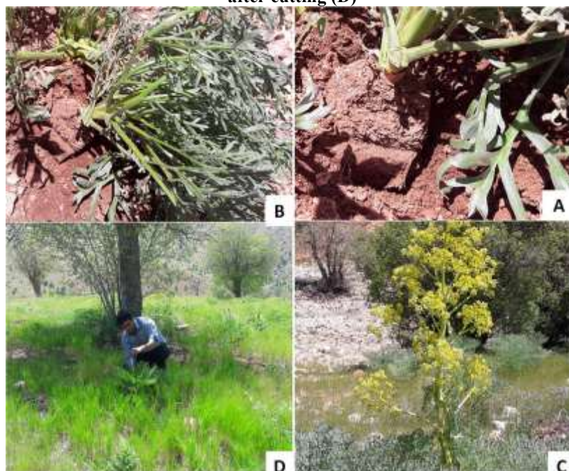
شکل ۳. گیاهان رویش‌یافته یکسال پس از برش، یک‌طرفه (A)، دو طرفه (B)، پایه گل‌دهنده (C) و ثبت ویژگی‌های مورفولوژیک (D) Figure 3. The first year after cutting; Unilateral (A), Bilateral (B), Flowering stage (C) and registration of the morphological characteristics (D)