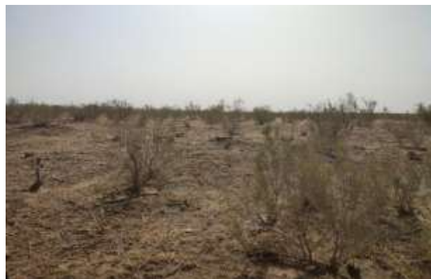
شکل ۱- نمای از رویشگاه سیاه‌تاغ

رویشگاه دست‌کاشت سیاه‌تاغ ( Haloxylon ammodendron )، واقع در منطقه حسین‌آباد میش‌مست (بخش کوچکی از فلات مرکزی ایران) در دشت قم با آب‌وهوایی خشک قرار دارد. تاغ‌کاری با مساحت ۳۱۸۰ هکتار در سال ۱۳۶۲ انجام شده و در سال‌های بعدی بنا به ضرورت واکاری شده است. این رویشگاه با ۸۶۴ متر ارتفاع از سطح دریا بین طول‌های جغرافیایی ۵۱ درجه و ۰۵ دقیقه تا ۵۱ درجه و ۲۱ دقیقه و عرض‌های جغرافیایی ۳۴ درجه و ۲۲ دقیقه تا ۳۴ درجه و ۳۵ دقیقه قرار گرفته است. با