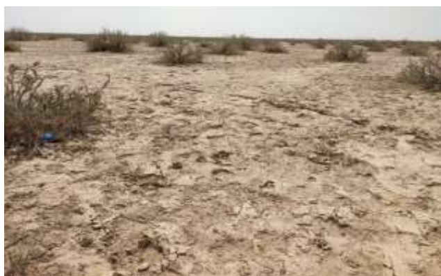
شکل ۲- نمایی از رویشگاه گز