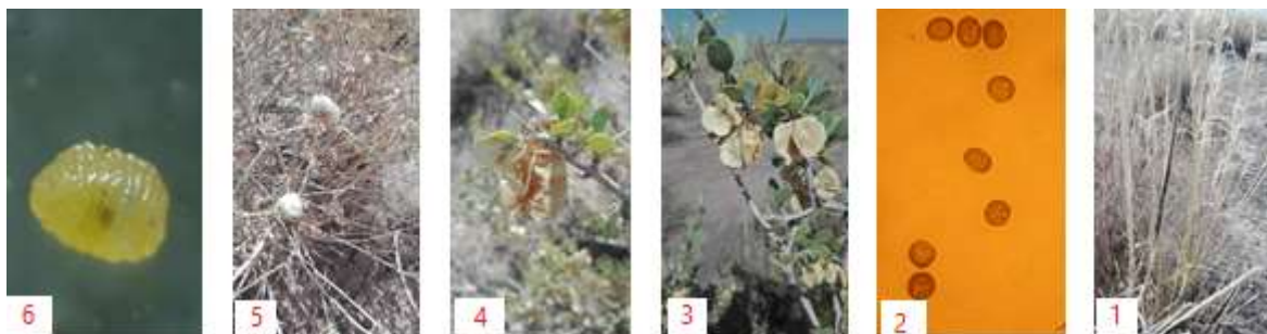
شکل ۱- علائم سیاهک استپی ریش‌دار (۱)، تلیوسپور سیاهک استپی ریش‌دار (۲)، علائم خسارت بذرخوار قبیج (۳ و ۴)، گال ایجادشده در گیاه درمنه Artemisia aucheri (۵) و لارو مگس خانواده Cecidomyiidae (۶)