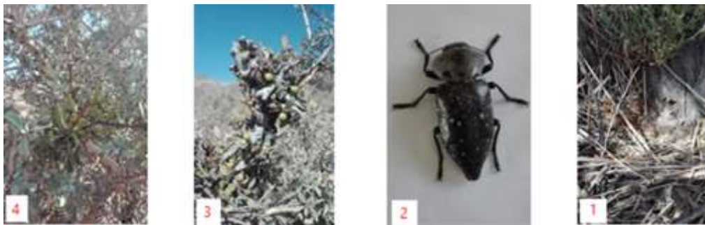
شکل ۳- خسارت چوب‌خوار در بادام کوهی ( Am. scoparia ) (۱)، حشره کامل چوب‌خوار (۲)، رشد داروایش از محل قبلی (۳)، آلودگی جدید به داروایش (۴)