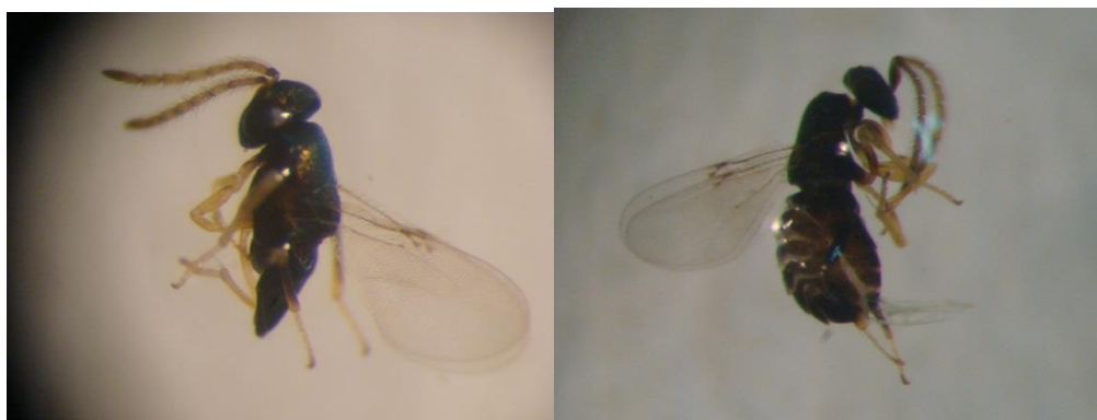
شکل ۷- زنبورهای پارازیت پسیل از خانواده Encyrtidae، راست: (چغازنبیل)، چپ: (کوشکک)

دشمنان طبیعی: دوگونه زنبور از خانواده Encyrtidae در مناطق حمیدآباد، چغازنبیل، کوشکک، گتوند، همچنین گونه‌هایی از خانواده Braconidae (کوشکک و چغازنبیل)