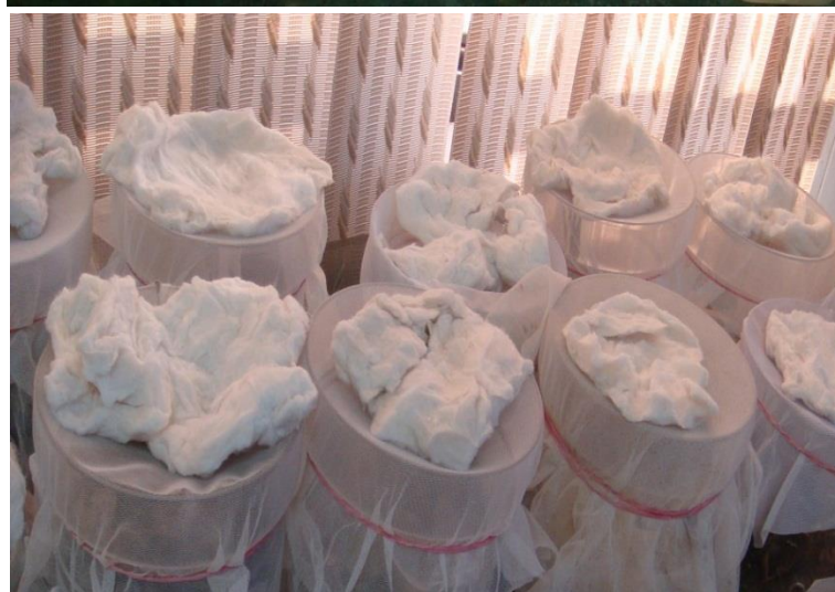
شکل ۲- بانکه‌های پرورش حشرات در آزمایشگاه گروه حمایت و حفاظت