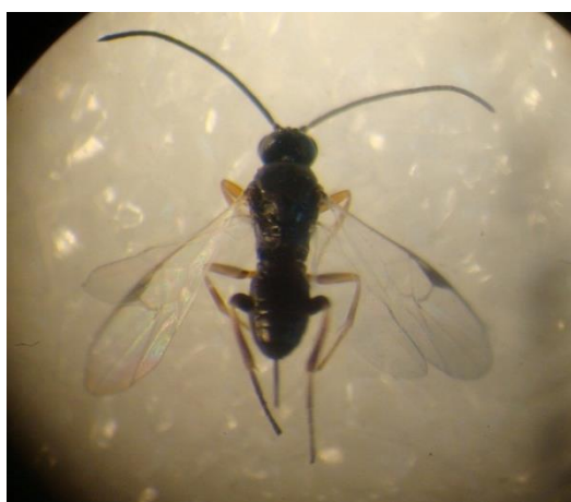
شکل ۵- زنبور پارازیت لارو پروانه Gypsonoma sp. از خانواده Braconidae (بستان)