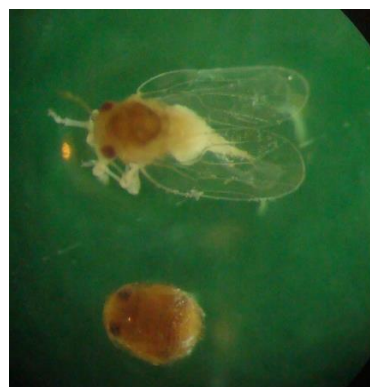
شکل ۹ - حشره کامل و پوره پسیل Syntomoza unicolor : راست و خسارت آن روی برگ پده (حمیدآباد دزفول): چپ

برخی از جنس Psyllophagus sp. نیز می‌باشند، پارازیت شده و حشرات کامل زنبور به همراه پوسته‌های پورگی پسیل در این نواحی به‌فراوانی دیده شدند. در بین