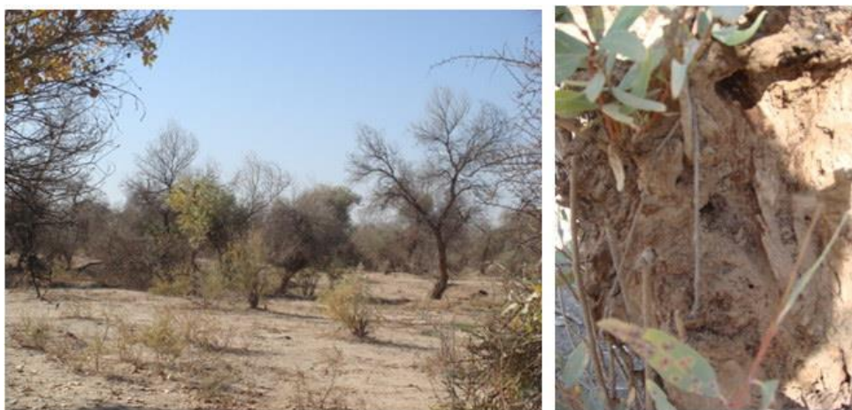
شکل ۱۶- خسارت دو گونه مورخانه Anacanthotermes vagans و Microcerotermes buettikeri روی تنه پده و خشکیدگی درختان (چغازنبیل)

چغازنبیل، همچنین همراه با گونه M. diversus از منطقه حمیدآباد دزفول جمع‌آوری گردید (جدول ۴ و شکل ۱۷).