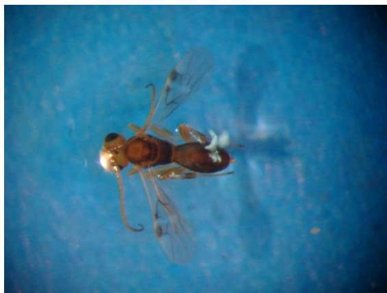
شکل ۸- زنبور پارازیت پسیل از خانواده Braconidae (چغازنبیل)

دسته‌های محدود، یا خیلی زیاد روی برگ‌های پده قرار می‌دهند. تخم‌ها به‌طور عمود، از محل قاعده در جوار هم قرار گرفته و به‌شکل خوشه گل درمی‌آیند. خسارت این گونه پسیل، به‌صورت پیچیدگی طولی برگ‌های جوان پده در انتهای شاخه‌ها دیده می‌شود که در نهایت شاخه‌ها خشک می‌شوند. این آفت از رویشگاه‌های مختلف استان جمع‌آوری شد. میزان خسارت در منطقه حمیدآباد زیاد، در مناطق کوشک و چغازنبیل متوسط و در منطقه حمیدیه کم است (جدول ۴ و شکل ۹).