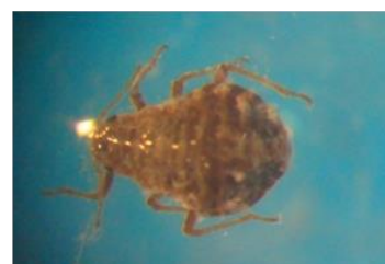
شکل ۱۱- شته Pachypappa sp.: راست و خسارت آن روی شاخه پده (حمیدآباد دزفول): وسط و چپ

Tapinoma Plagiolepis Cf. abyssinica Forel Polyrhachis lacteipennis (F. simrothi Krausse Cataglyphis Crematogaster Cf. auberti Smith.)