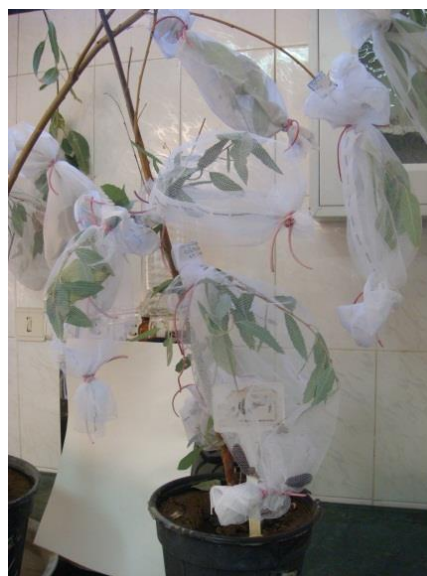
شکل ۳- پرورش لارو حشرات روی نهال گلدانی پده

از نهال‌های گلدانی رشد کرده پده برای پرورش مراحل نابالغ حشرات به‌ویژه پروانه‌ها استفاده شد. به این منظور هر شاخه از نهال با کیسه‌های سفید رنگی از جنس توری ریز بافت پوشانده شد. شاخه‌های آلوده به تخم، یا لارو حشرات به داخل توری منتقل و روی شاخه سالم نهال‌ها بسته شد. با بازدیدهای روزانه از این نهال‌ها، نسبت به جمع‌آوری حشرات کامل اقدام گردید (شکل ۳).