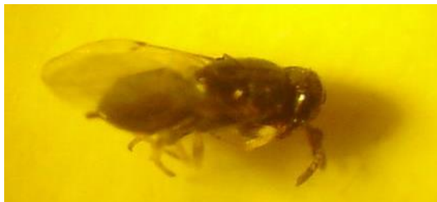
شکل ۱۰- زنبور پارازیت پوره‌های پسپیل S. unicolor از خانواده Encyrtidae (حمیدآباد دزفول)

شکارگرها، گونه سن Deraeocoris pilipes در جمعیت پوره و حشره کامل این گونه پسپیل (حمیدآباد) فعالیت تغذیه‌ای داشتند (جدول ۵).