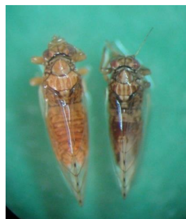
شکل ۶- پسیل Egeirotrioza ceardi (دزفول): راست Egeirotrioza intermedia (بستان): چپ