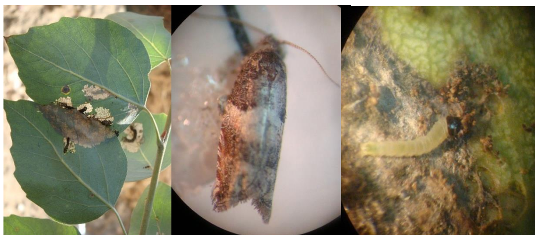
شکل ۴- گونه‌ای از جنس Gypsonoma sp. (لارو و حشره کامل): راست و وسط و خسارت لارو روی برگ پده (بستان): چپ

دشمنان طبیعی: گونه‌های زنبور از خانواده‌های Braconidae (چغازنبیل، کوشکک، حمیدیه و بستان) (شکل ۵)، Ichneumonidae (حمیدآباد و حمیدیه) و Eulophidae (کوشکک و حمیدیه)، لاروها و یا سفیره‌های جنس Gypsonoma را پارازیت می‌نمایند. در بعضی از مناطق مورد بررسی، در جمعیت لاروهای برگخوار متعلق به