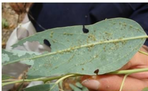
شکل ۱۲- شته Chaitophorus euphraticus (کوشک شوشتر)

lividus (Andre) و نیز دو گونه ناشناخته از دو جنس Camponotus sp. و Pheidol sp. دیده می‌شوند. عسلک حاصل از فعالیت این شته‌ها اغلب زیاد و موجب خیس