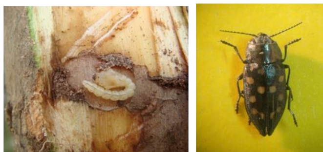
شکل ۱۵- سوسک چوبخوار Melanophyla picta : راست و فعالیت تغذیه‌ای لارو آن روی تنه: چپ

سوسک چوبخوار صنوبر Melanophyla picta Pall. در اثر تغذیه لاروهای این حشره چوبخوار از پوست و ناحیه برون چوب تنه، نوارها و صفحات نامنظمی روی آنها ایجاد می‌شود، همچنین تجمع فضولات و خاک اره، در فضای ایجاد شده، موجب قطع ارتباط بین پوست و