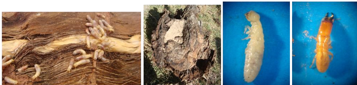
شکل ۱۸- مورخانه Postelectrotermes pasniensis سرباز (راست)، کارگر (چپ) و کلنی آنها داخل تنه

مورخانه چوب خشک Postelectrotermes pasniensis Akhtar این آفت اوایل آذرماه داخل کنده پوسیده پده از روستای