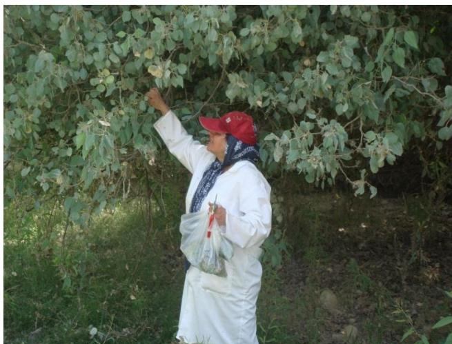
شکل ۱- جمع آوری شاخه‌های آلوده پده (حمیدآباد دزفول)