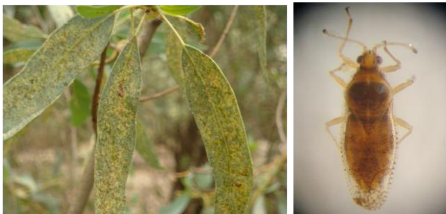
شکل ۱۴- سنک Monosteira unicostata : راست و خسارت آن روی برگ پده (کوشکک شوشتر): چپ

چوب می‌گردد. درختان مورد حمله، در اثر حملات پی در پی آفت طی سال‌های مختلف خشک می‌شوند. این آفت در رویشگاه‌های مختلف به‌ویژه رویشگاه دز (منطقه حمیدآباد) روی تنه درختان پده فعالیت می‌کند (جدول ۴ و شکل ۱۵).