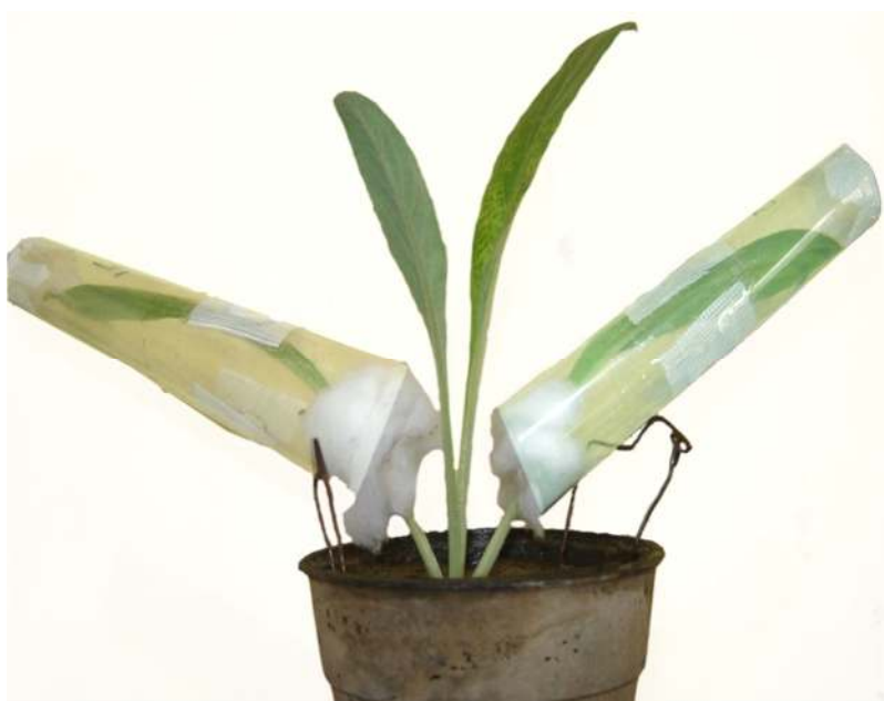
شکل ۱- قفس‌های برگی روی برگ کنگرفرنگی

انتقال داده شد. بعد از ۲۴ ساعت حشرات بالغ حذف و چهار پوره هم‌سن روی برگ گیاه کنگرفرنگی قرار گرفتند تا بالغ شده و شروع به تولیدمثل کنند. روی برگ دارای پوره‌ها قفس برگی نصب شد و به صورت روزانه قفس‌ها بازدید و با کامل شدن شته‌ها به جز یکی بقیه حذف و تولیدمثل روزانه آن شته تا پایان دوره تولیدمثل ثبت شد. این روند تا مرگ حشره کامل ادامه یافت. با این روش طول عمر، طول دوره پوره‌زایی، طول دوره پس از پوره‌زایی، طول عمر