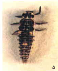
شکل شماره ۱- مراحل مختلف رشدی کفشدوزک O. conglobata . ۱- تخم ۲- لارو سن اول پس از خروج از تخم ۳- لارو سن دوم ۴- لارو سن سوم ۵- لارو سن چهارم ۶- حشره کامل.