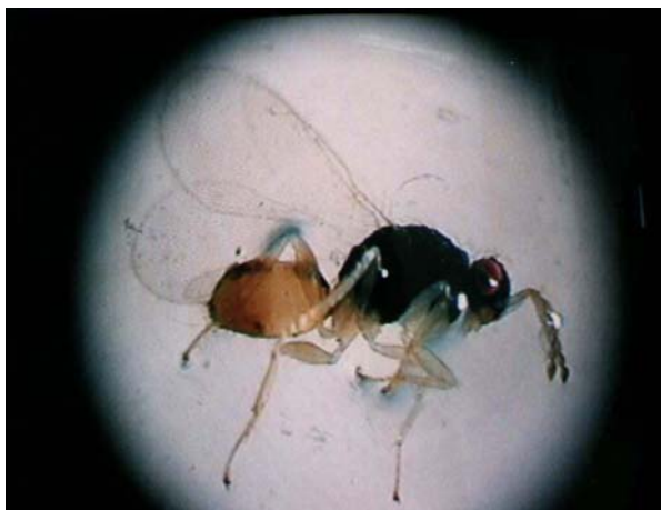
شکل ۲- زنبور ائولوفید Euplectrus sp. پارازیتوئید لارو پروانه دم‌قهوه‌ای در ارسباران