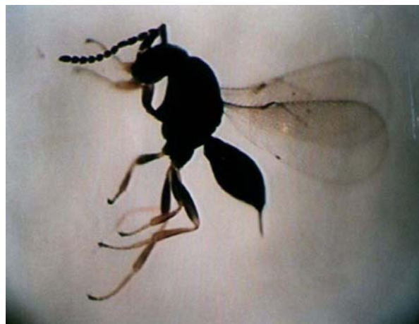
شکل ۱- زنبور سلینوئید پارازیتوئید تخم پروانه دم‌قهوه‌ای در ارسباران