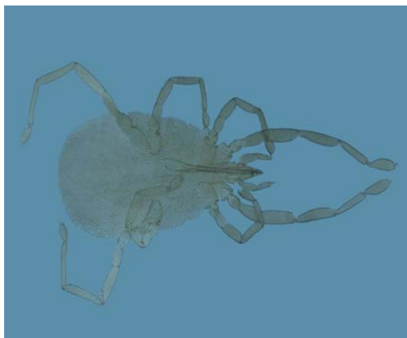
شکل ۳- کنه Callidosoma sp. (Acari: Erythraeidae) انگل لارو پروانه دم‌قهوه‌ای در ارسباران

- مدرس اول، م، ۱۳۷۳. فهرست آفات کشاورزی ایران و دشمنان طبیعی آنها. انتشارات دانشگاه فردوسی مشهد. ۳۶۴ صفحه. - ملکشی، ح. و ابراهیمی، ا.، ۱۳۷۹. معرفی زنبورهای پارازیتوئید مگسهای سیرفیده از باغهای درختان میوه دانه‌دار منطقه بجنورد. خلاصه مقالات چهارمین کنگره گیاهپزشکی ایران، دانشگاه اصفهان، ۷۱-۱۴ شهریور: ص ۲۳۲.