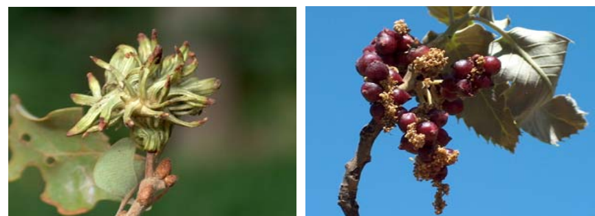
شکل ۱- گال نسل جنسی (راست) و غیر جنسی (چپ) A. grossulariae