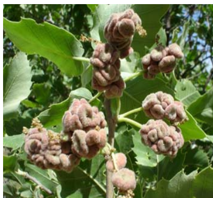
شکل ۳- گال نسل جنسی A. ceconii