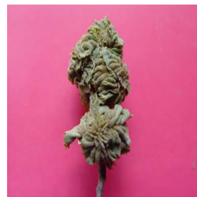
شکل ۴- گال نسل جنسی A. multiplicatus